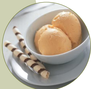
Speiseeis zubereiten - schnell, lecker und kalorienarm