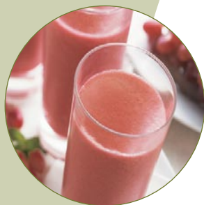
Säfte und Smoothies aus vollwertigem Obst und Gemüse