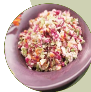
Nass zerkleinern - nahrhafter Krautsalat mit viel Vitamin C