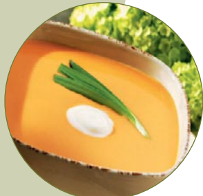
Kochend heiße Suppen aus frischen Zutaten