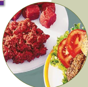
Fleisch hacken - spart Geld und schont die Nährstoffe