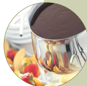
Fondues schnell und einfach