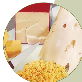
In Sekundenschnelle Käse reiben