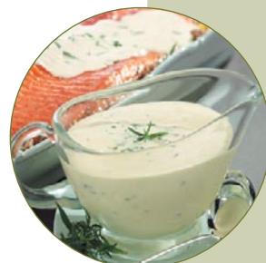
Saucen ohne Rühren - ganz ohne Klümpchen