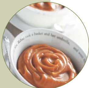
Frische, natürliche Babykost und Saucen pürieren