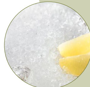
2 Liter Eis in 3 Sekunden zerkleinern