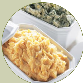
Kräuterbutter aus frischer Sahne