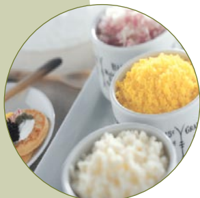
Trocken zerkleinern - ideal für Zwiebeln, Käse und gekochte Eier